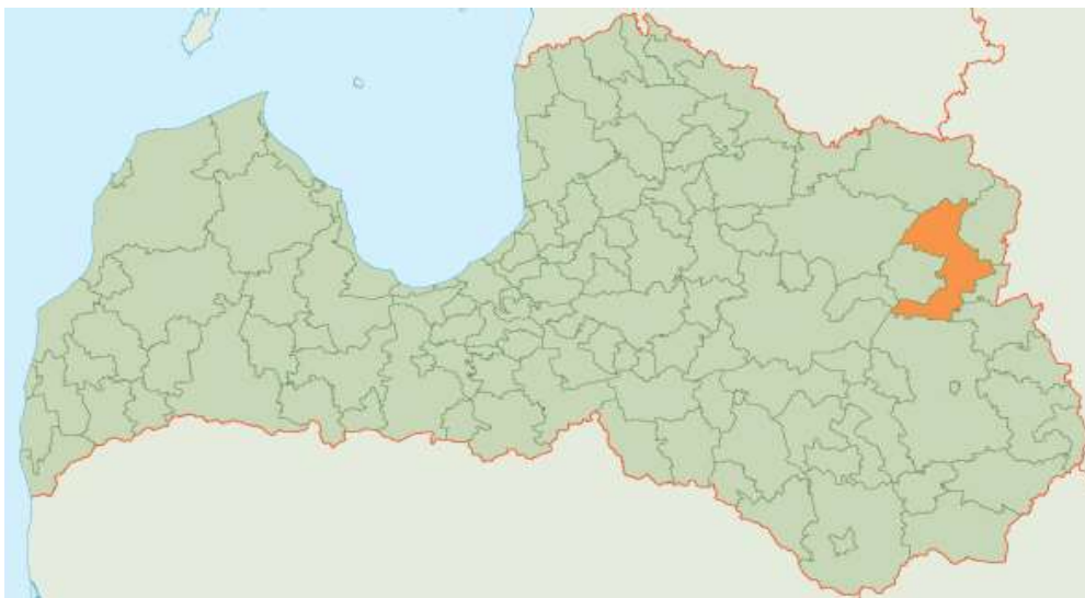
1.attēls. Balvu novada atrašanās vieta

Balvu novads izveidots 2009.gadā apvienojoties 10 pagastiem (Balvu, Bērzkalnes, Bērzpils, Briežuciema, Krišjāņu, Kubulu, Lazdulejas, Tilžas, Vectilžas un Vīksnas) un Balvu pilsētai. Novads atrodas Latgales plānošanas reģionā un aizņem 1045 km 2 lielu platību.